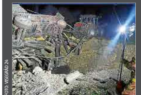
Imagen del impacto de los misiles.