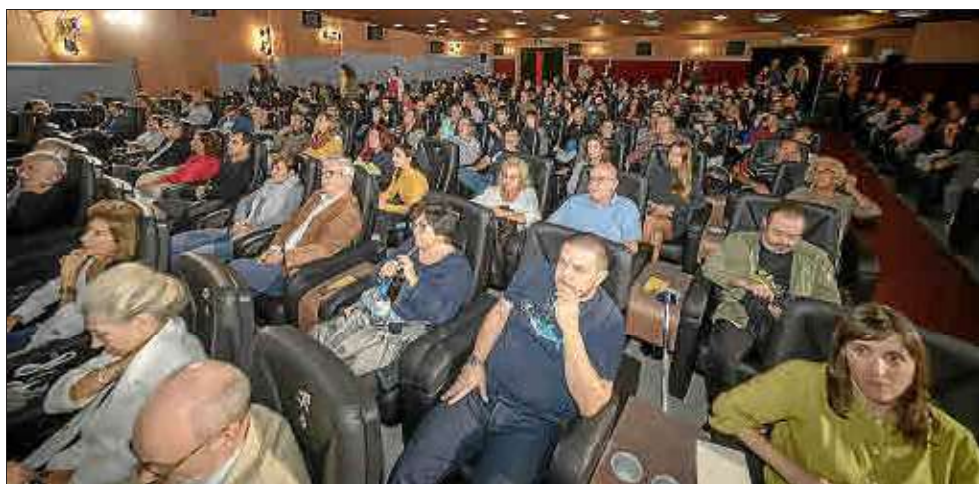
El público llenó la sala del Cine Rivoli y disfrutó con las imágenes del documental.

Primeras imágenes. En el acto se proyectó un avance de veinte minutos de la serie documental de IB3 y Marilles Foundation 'Arxipélag Blau'. El estreno oficial tendrá lugar el año que viene. El documental muestra ahora nunca vistas del Mar Balear.